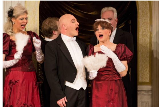
Fotos von der Premiere in Düsseldorf März'19